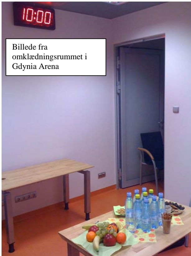
Billede fra omklædningsrummet i Gdynia Arena

Dagen forinden havde Asseco Prokom spillet mod Partizan mt:s Beograd for ca. 4.500 tilskuere i den samme hal. Så da vi ankom til hallen sad der stadigvæk skilte med holdnavnene fra gårsdagens kamp på dørene til nogle af omklædningsrummene. Så atmosfæren var sat fra starten. Efter en kort besigtigelse af hallen fik vi anvist vores omklædningsrum, hvor der var anrettet lidt vand, frugt og snacks, som det kan ses på det næste billede. På dette billede kan man også se, at der var et ur i omklædningsrummet, der er linket med kampuret i hallen, således at vi før kampen og i pausen altid kunne se, hvor lang tid, der var tilbage inden starten af 1./2. Halvleg. Da jeg skulle dømme sammen med en kvindelig og en mandlig dommer fik vi selvfølgelig anvist to omklædningsrum.